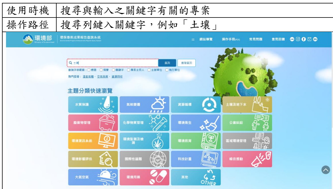
表 2 系統操作說明表_一般查詢