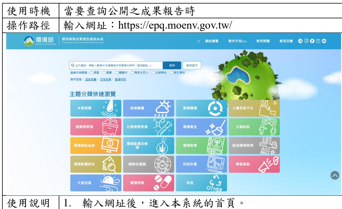
表 1 系統操作說明表_進入首頁