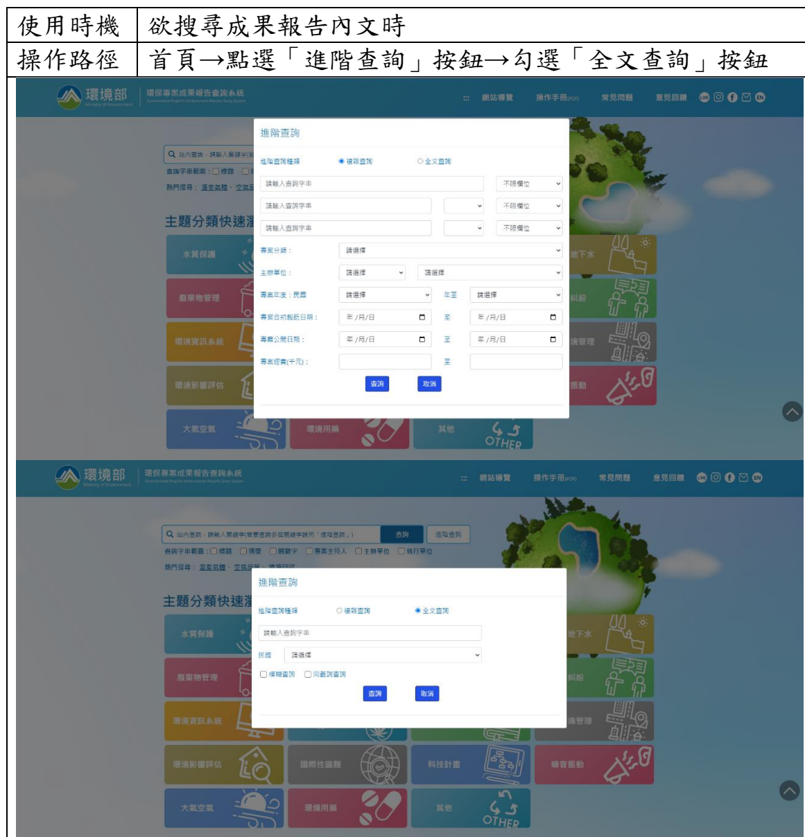
表 3 系統操作說明表_全文檢索